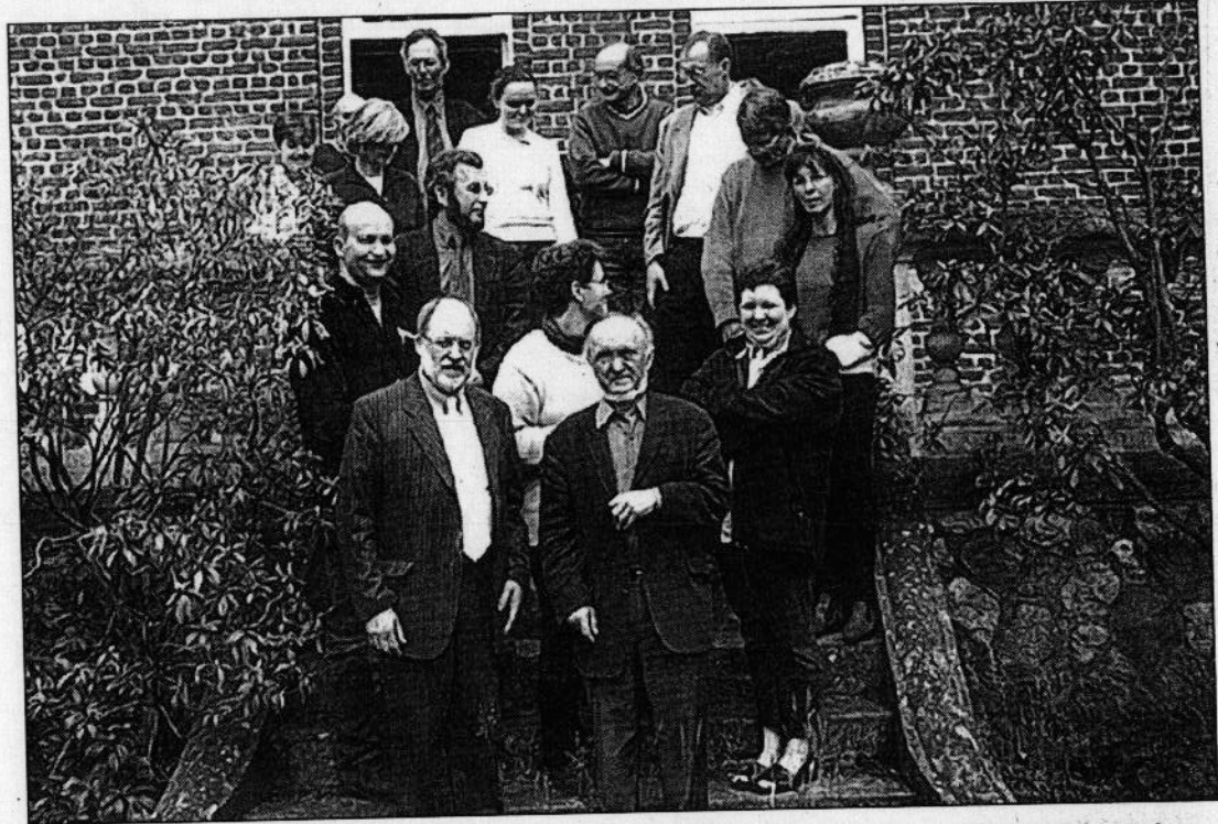
Albert Jacquard a aussi rencontré l'équipe éducative de Buzet. Une rencontre enrichissante pour tous.

La pédagogie appliquée à la « maison des enfants » privilégiée